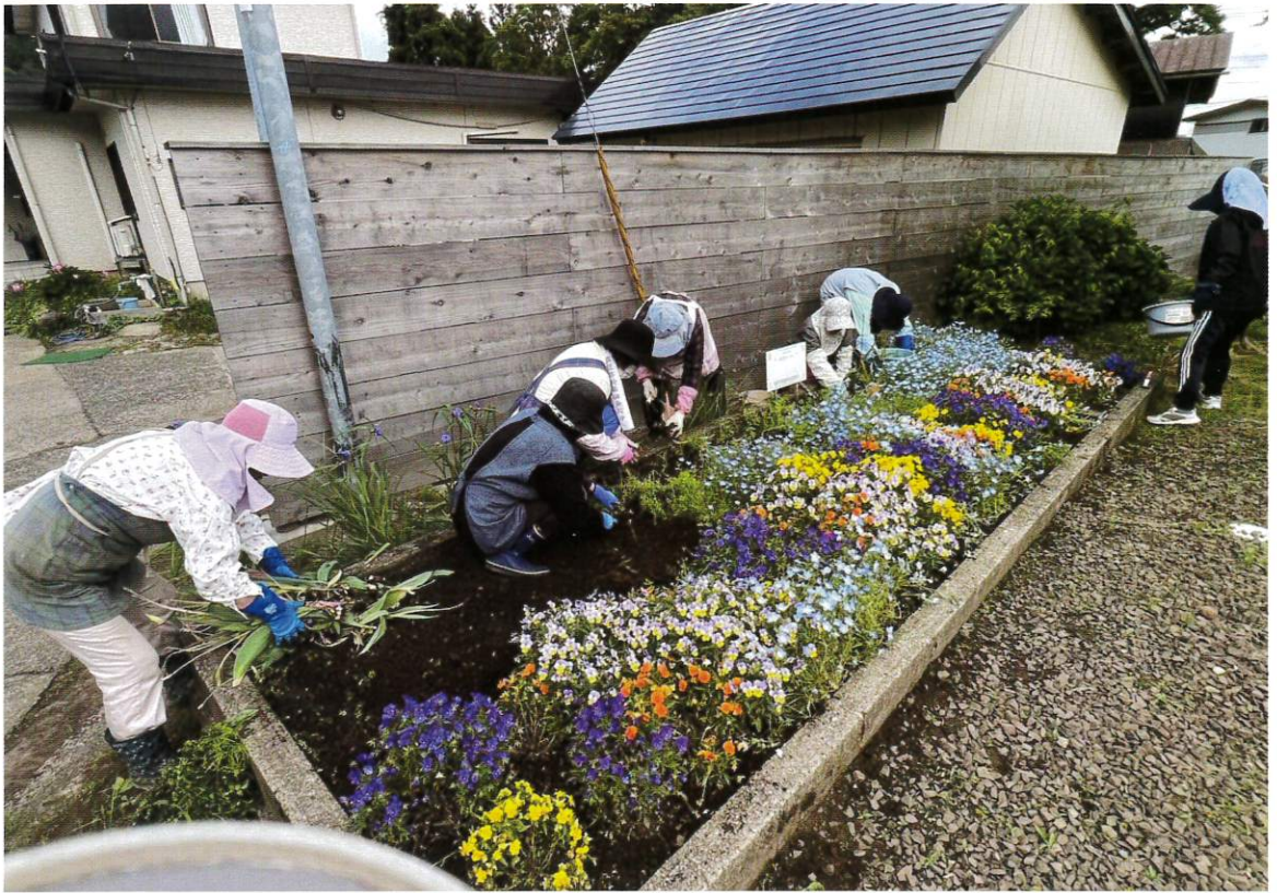
下新城岩城地区槻ノ木公民館での「お茶っこ会」前の花植え活動の様子