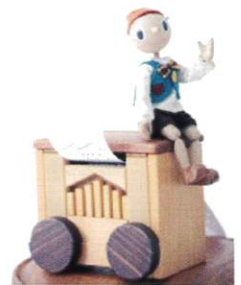
手回しオルゴールとマリオネット“ジロー”君